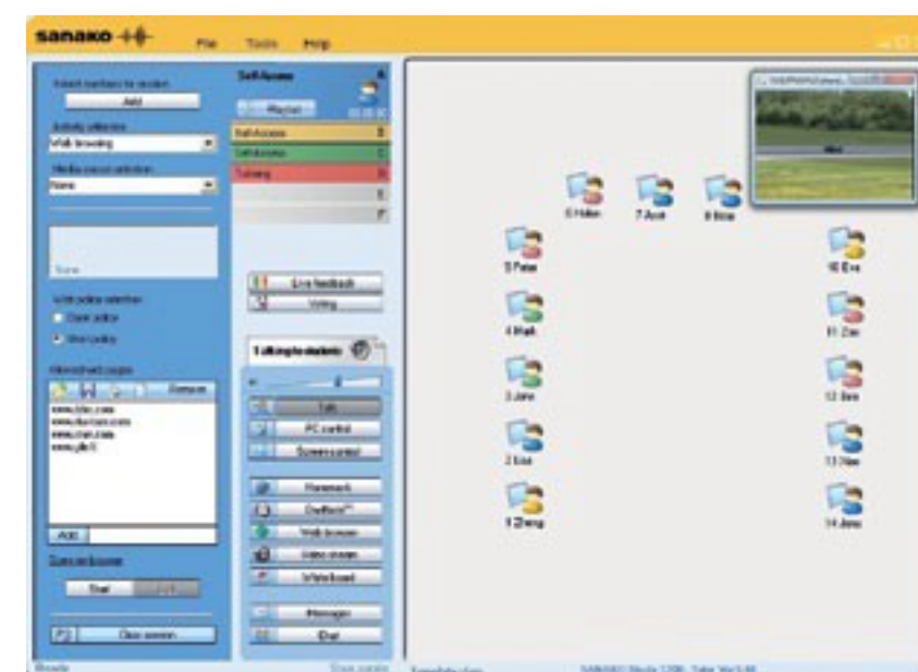
Interface professeur Sanako Study 1200